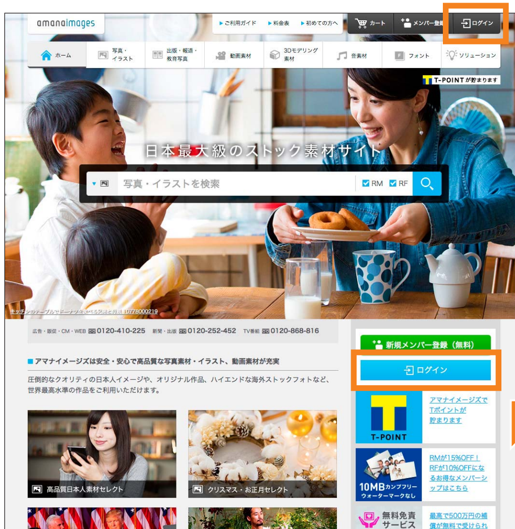
トップページ (ホーム)