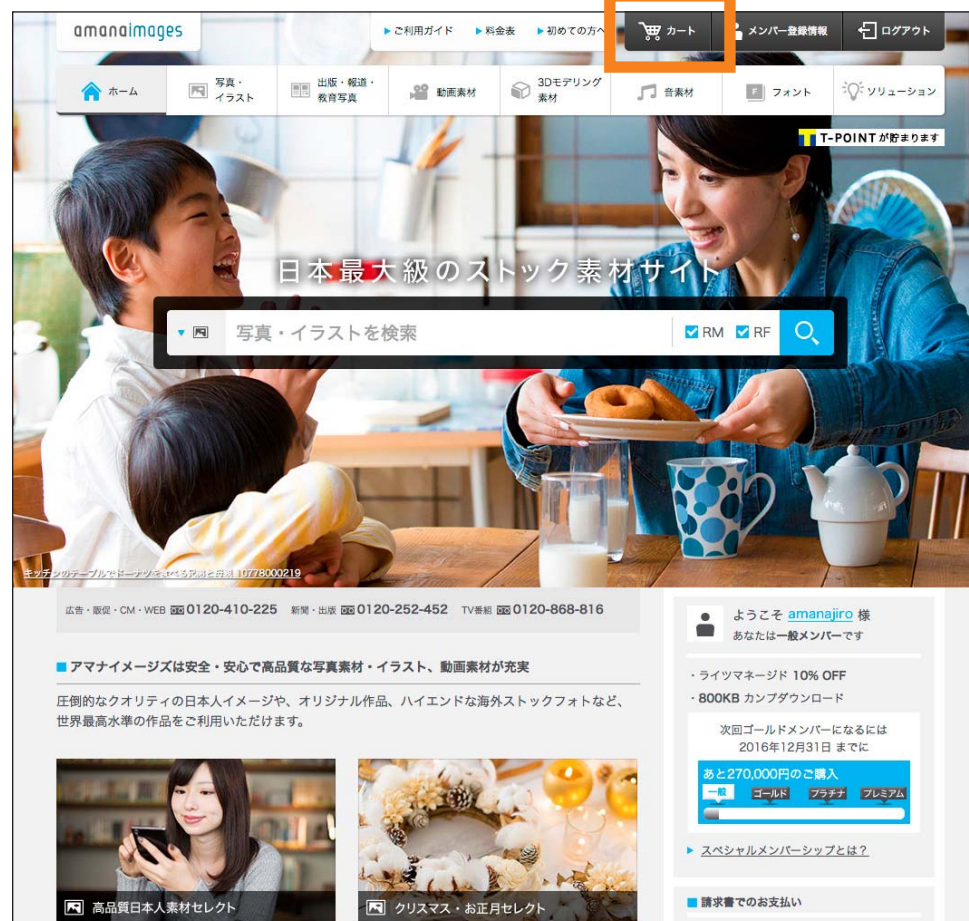
トップページ（ホーム）